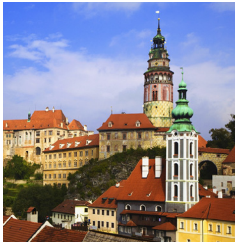
Město Český Krumlov údajně kvůli neplacícím podnikatelům ročně ztrácí až pět milionů korun

ty přinesou řadu výhod i zvýšení komfortu v nakládání s odpady.