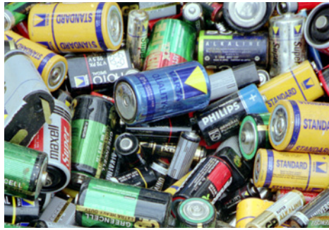
Firma neodebrala odpovídající množství baterií a dostala za to pokutu

„Firma porušila zákon o odpadech. Bylo jí prokázáno, že v roce 2014 nesplnila jako dovozce přenosných baterií a akumulátorů svou zákonnou povinnost zpětně odebrat takové množství použitých přenosných baterií a akumulátorů, které odpovídá 25 procentům toho, co sama uvedla na český trh. Zpětně odebrala pouze necelých 14 procent,“ uvedl Karel Kozubek, ředitel Oblastního inspektorátu ČÍŽP v Ostravě. O tom, že zákonné cíle sběru plní, se dokonce firma snažila přesvědčit Ministerstvo životního prostředí v rámci každoročního reportingu, kde uváděla nepřesné a nepravdivé údaje. Dalším pochybením bylo, že na svých internetových stránkách nezveřejňovala kompletní aktuální seznam míst zpětného odběru baterií, což jí ukládá zákon